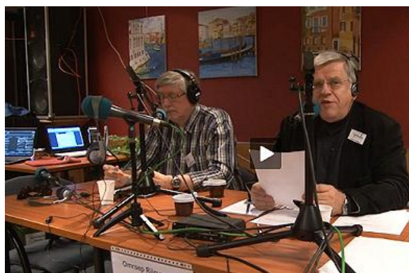
De uitslag van de poll wordt bekend gemaakt

Met de gegevens uit de exit-poll kon Omroep Rijnwoude al vroeg in de avond een prognose maken van de uitslag van het referendum. De toch wel verrassende