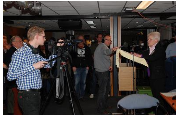
De burgemeester maakt de uitslag bekend

Omdat de omroep in de exit-poll ook naar de politieke voorkeur van de kiezers had gevraagd, kon worden geanalyseerd hoe de aanhangers van de verschillende politieke partijen had gestemd in het referendum.