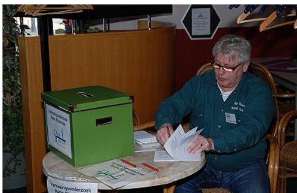
De stembus van Omroep Rijnwoude

Omroep Rijnwoude voerde een exit-poll uit in de stembureaus. De omroep vroeg aan een steekproef van 446 kiezers om nog een keer te stemmen, maar dan met een eigen stembiljet van de omroep. Daarop konden de kiezers aangeven hoe ze hadden gestemd bij het referendum en ook op welke partij ze hadden gestemd bij de gemeenteraadsverkiezingen.